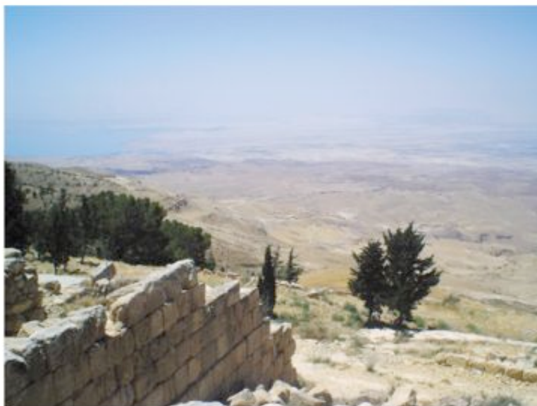
Berget Nebo där Mose fick se in i Israel

Nästa anhalt var klippstaden Petra som ur ett rent kristet perspektiv inte bär på så mycket minnen förutom en del byggnader som på 600-talet förvandlades till kyrkor. Men det är en andlöst spännande upplevelse att se, eller snarare erfara, ruinerna av den gamla staden uthuggna ur klipporna. De första 800 meterna kan man ta sig med häst - lugnt ledsagad av en förare - innan man når den djupa sprickan som utgör vägen till staden. Man går bokstavligt talat tvärs igenom ett berg på slät väg, fem, tio meter bred, och väggarna reser sig lodrätt upp till 200 meters höjd. De uppvisar en mångfald färger som skiftar i takt med solens rörelser, och det regnvatten som rinner nerför väggarna samlades tidigare upp i kanaler som finns utmed hela dalgången. I slutet på dalen finner man sig plötsligt stå inför Al-Khaznah, skattkammaren, den